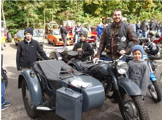
Motorrad KMZ (Dnepr) mit Beiwagen hatte die weiteste Anreise aus Straubing (100 km) Baujahr 1961

auf dem Gelände der Kartübungsfläche gehalten. Weil in Zeilarn die damaligen Flächen verbaut sind. Den Oldtimerfrühschoppen gibt es seit 2013. Ein fester Bestandteil im Jahresprogramm des Motorsportclubs. Aus dem Nähkästchen geplaudert war ein Motorrad mit Beiwagen aus Straubing.