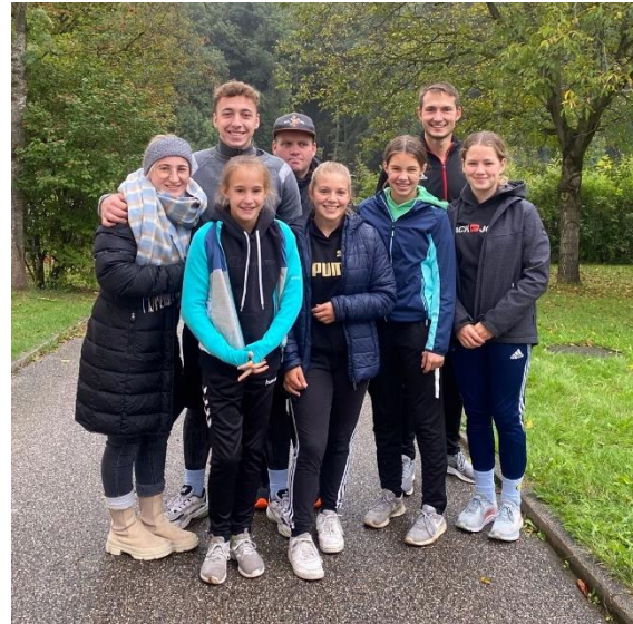
Team der SF Zeilarn bei den Landjugendspielen

Wie jedes Jahr organisierte der KLJB Zeilarn die Landjugendspiele. Bei diesen Spielen geht es um Geschicklichkeit, Schnelligkeit und Allgemeinwissen. Dabei traten die Leichtathleten aus Zeilarn als Ortsgruppe an und schlugen sich dabei beachtlich gut. Am Ende wurden die Leichtathleten aufgrund eines verlorenen Stechens gegen den MSC Zeilarn unglückliche vierte. Trotz des kalten und nassen Wetters hatten die Teilnehmer viel Spaß. Wir freuen uns schon auf nächstes Jahr!