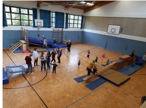
Trainingsparcour für die Kinder beim Eltern-Kind-Turnen

Aktuell sind dies ca. 42 Familien, die regelmäßig daran teilnehmen. Da die Kapazität der Turnhalle nur ca. 25 Familien zulässt, muss man sich über eine Whatsapp-Gruppe anmelden. Die meisten Teilnehmer stammen aus Zeilarn, Gumpersdorf und Erlbach. Aber auch Peracher, Tanner, Wurmannsquicker und Julbacher nehmen daran teil.