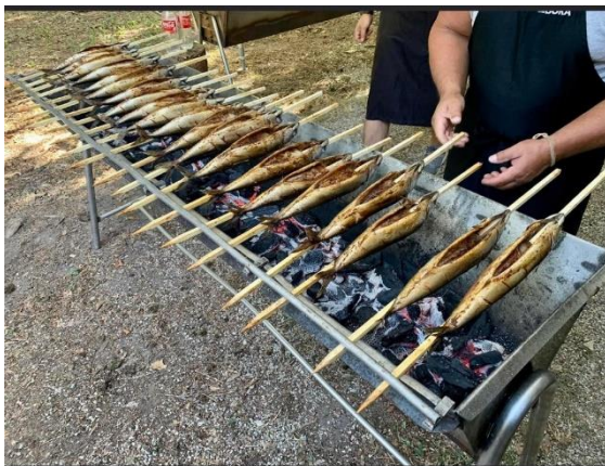
Steckerfischgrillen beim Waldfest der SG Schildthurn

Nach 2jähriger Corona-Pause konnte nun endlich wieder unser Waldfest im altbekannten Rahmen stattfinden. Mit großer Vorfreude stürzten wir uns in die Vorbereitungs- und Aufbauarbeiten. Auch unsere Schützenjugend war mit vollem Elan dabei.