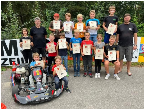
Ferienprogramm beim MSC Zeilarn

Der Parcours auf dem Übungsplatz in Grillenhögl wartete schon auf die Kinder, die im Rahmen des Ferienprogrammes des MSC Zeilarn mit den Karts ihre Runden fahren durften.