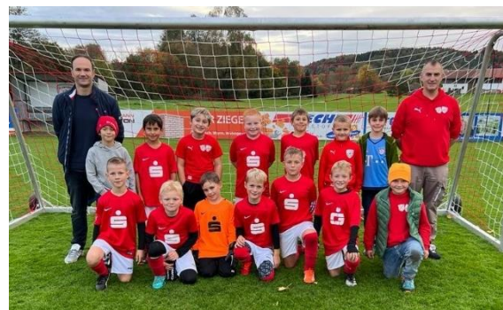
Mannschaft nach gewonnener Herbstmeisterschaft

Gump./Erlbach – SG Julbach/Kirchdorf 6:3