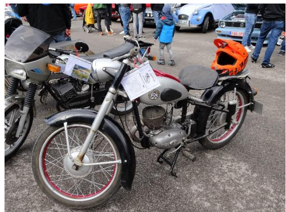
Hercules Baujahr 1952 (wohl das älteste Fahrzeug beim Oldtimerfrühstopp)

Es war ein Frühschoppen für alle Oldtimerbegeisterte und Oldtimerfreunde. Beim Rundgang durch die aufgereihten fahrbaren Untersetter konnten Schätze und Raritäten zum Teil aus dem Jahr 1952 bestaunt werden. Darunter auch ein türkisfarbener Cadillac Baujahr 1960) der mit seinem Inhaber gekommen war und auf Hochglanz poliert war. Mopeds aus längst vergangenen Zeiten, sorgten beim Treffen für Aufsehen.