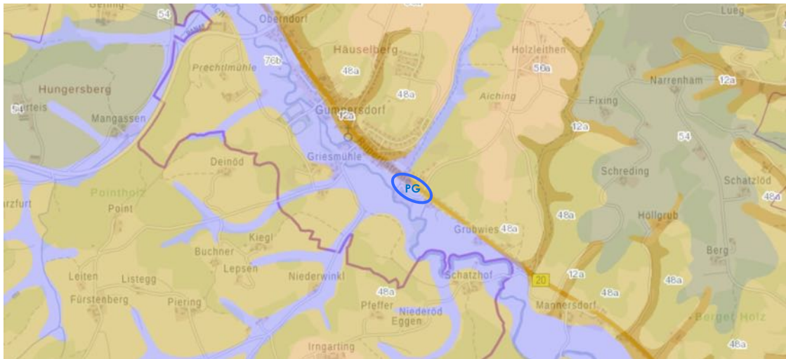
Abbildung des ÜBK25-Ausschnitts aus dem Umwelt-Atlas des Bayerischen Landesamts für Umwelt

Gemäß der Übersichtsbodenkarte des Bayerischen Landesamts für Umwelt (LfU) im Maßstab 1:25.000 befindet sich das Planungsgebiet auf der nachfolgend beschriebenen Legendeneinheit.