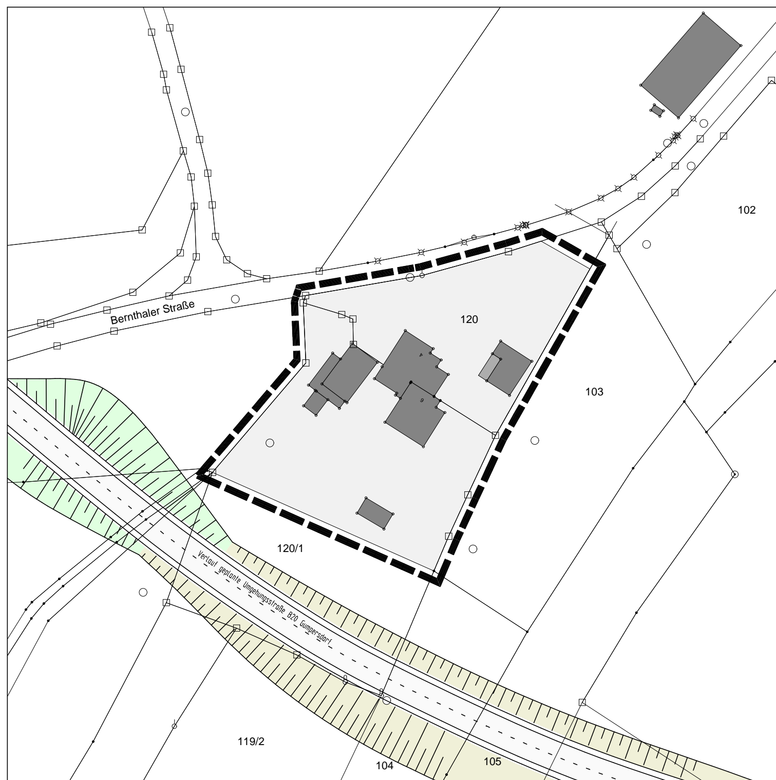
Lageplan M 1:1000