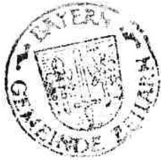
Werner Lechl 1. Bürgermeister