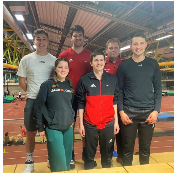
Die Zeilarn Leichtathleten bei der Südbayerischen Meisterschaft

4x200m Staffel. Dabei waren die Sprinter bis zum 3. Wechsel gut in der Zeit schieden dann aber durch ein Wechselfehler aus.